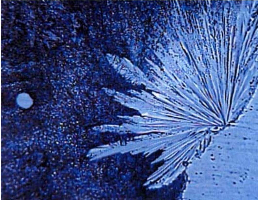
Foto ampliada 400 veces

Prueba: Conscious Living, test de agua: activador de agua